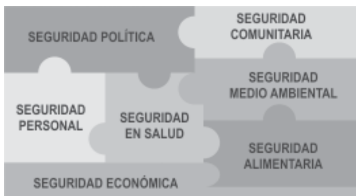
FIGURA 1: Componentes de la seguridad humana en la perspectiva de los derechos humanos. Fuente: PNUD Programa de Naciones Unidas para el Desarrollo.

de vista sus interrelaciones, es posible lograr un acercamiento a actividades incluidas en procesos de formación para la paz que promuevan una intervención efectiva y facilitadora de propuestas de prevención tempranas y oportunas para las comunidades donde finalmente se interviene.